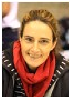
AN DE ROOST